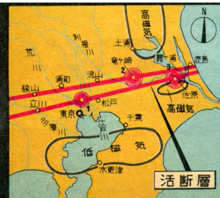
過去の大地震の震源 1 安政2年 M(マグニチュード)6.9 2 大正10年 M7.1 3 明治28年 M7.3